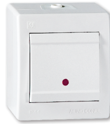
jednopolna sa indikacijom (art.2511.xx, 2551.xx, 2561.xx, 259.xx)