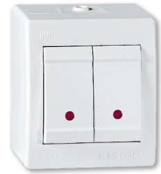
serijska sa indikacijom (art.2521.xx)