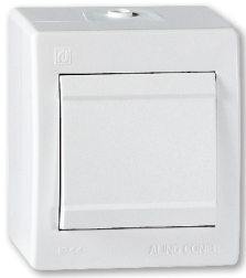
jednopolna (art.251.xx, 255.xx, 256.xx) naizmjenična (art.253.xx) ukrsna (art.254.xx)