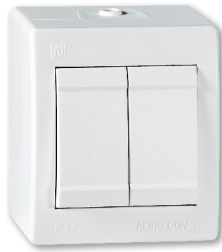
serijska (art.252.xx) sklopka za roletne (art.257.xx)